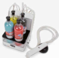
60 MLD00 00