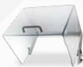
60 MLEP1 00