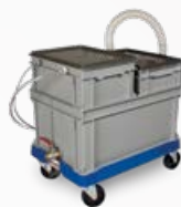
60 A0029 00